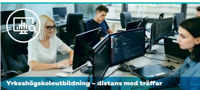
Yrkehögskoleutbildning – distans med träffar

Antal veckor: 60-100, beroende på förkunskaper.