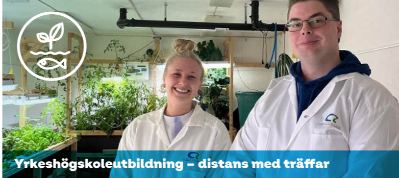
Yrkehögskoleutbildning – distans med träffar

Klicka på QR-koden (digital pdf) eller skanna QR-koden (utskrift).