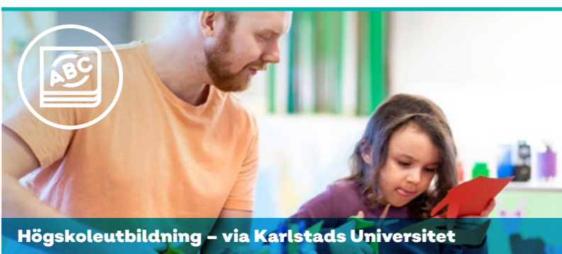
Högskoleutbildning – via Karlstads Universitet