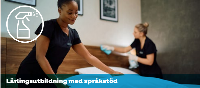
Läringsutbildning med språkstöd