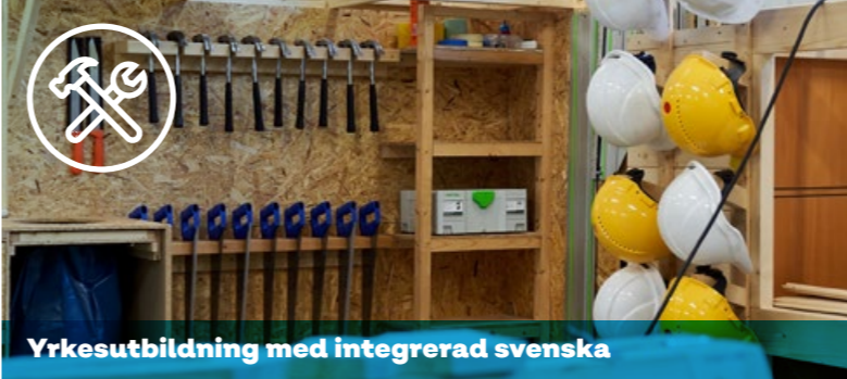
Yrkesutbildning med integrerad svenska