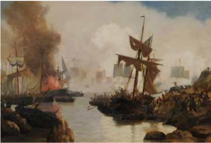
2_Dynekilen_Tordenskiold i Dynekilen by Carl Neumann.jpg