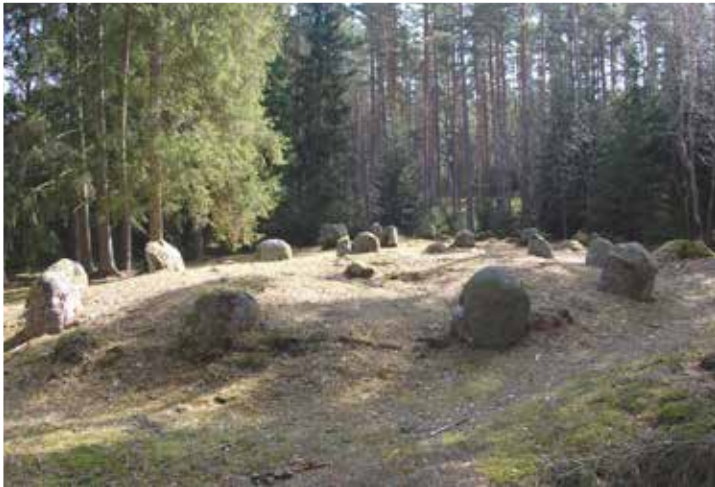
6_Dårskilds-högar-har-mange-steinringer-av-ulik-størrelse_alle-har-reiste-stener-med-oddetail-som-fem,-syv,-ni,-elleve- osv_ DSC_8561.jpg