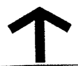
Skala 1:1000 vid ritning i A3-format

Antagen av MN 2003-04-29 Laga kraft 2003-06-10 Enkelt planförfarande