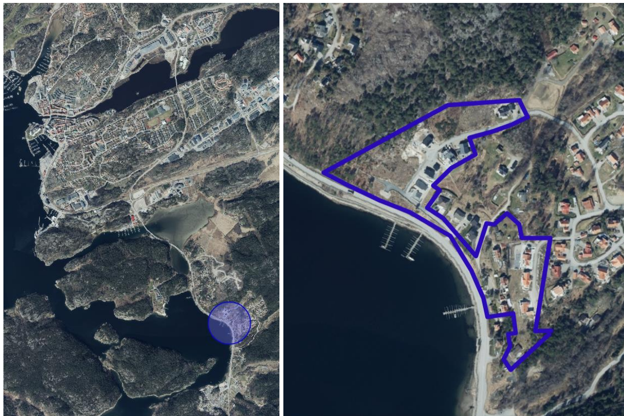
Planområdets läge i kommunen och detaljplanens utbredning i Stare.

Planområdet är beläget i Stare, ett par kilometer söder om tätorten och berör 20 bostadstomter bebyggda med friliggande enbostadshus.