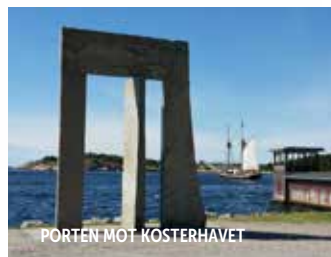
PORTEN MOT KOSTERHAVET