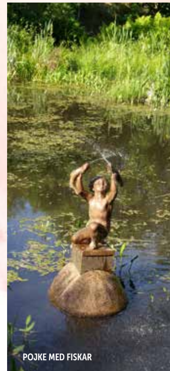
POJKE MED FISKAR