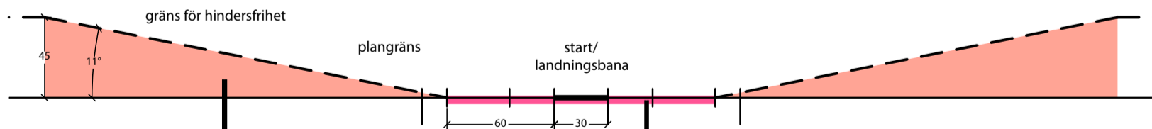
LÄNGDSEKTION Skala 1:3000

ÖVERGÅNGSYTA Lutning 20% Höjd 0m (+35m öh) till 45m (+80m öh)