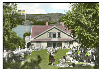
1950-talet. Servering på gräsmattan ovanför värdshuset.