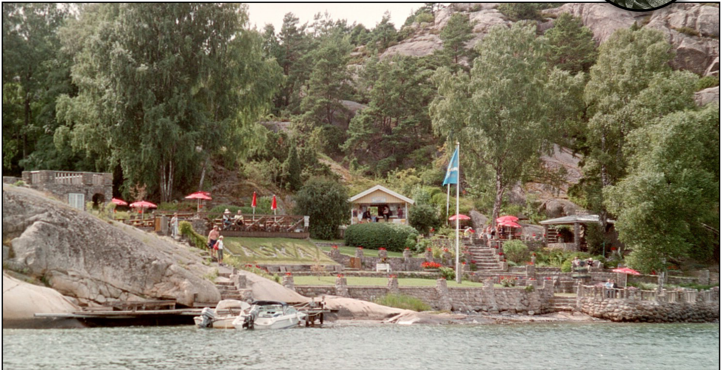
TRÄDGÅRD AV CEMENT. Trädgården Hilmas Alaska utanför Strömstad lockar massor av besökare på somrarna.

Det här är en av Sveriges mest galna sevärigheter.