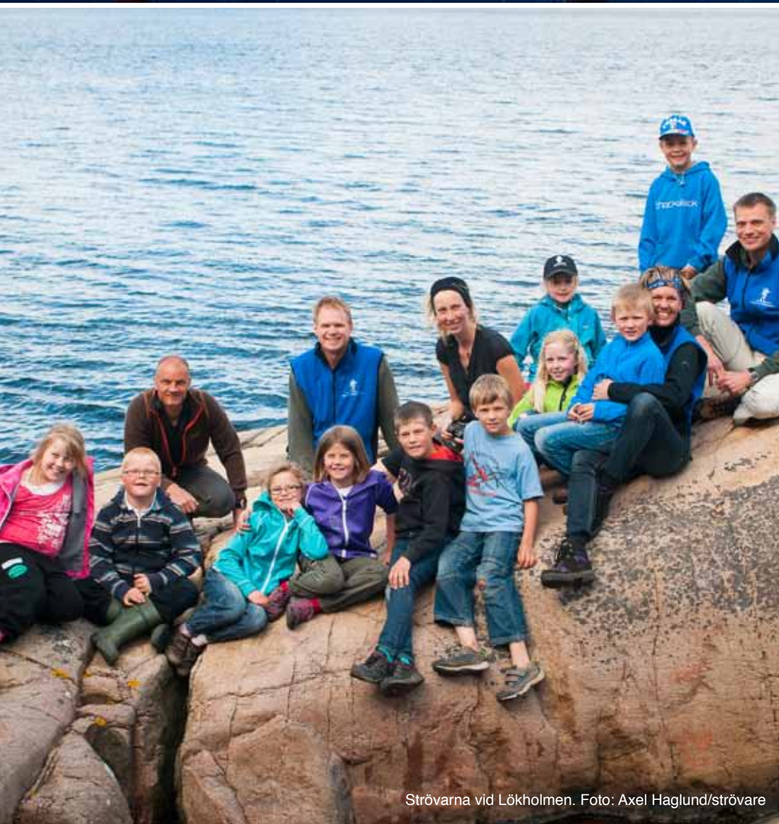
Strövarna vid Löcholmen.