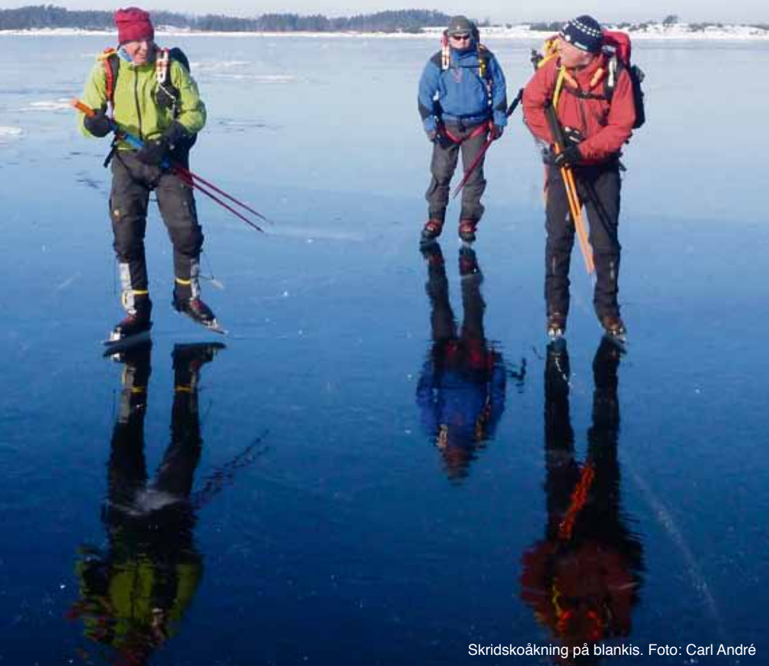
Skridskoåkning på blankis.

Olav Tryggvasson föddes omkring år 968 och blev sedan kung i Norge.