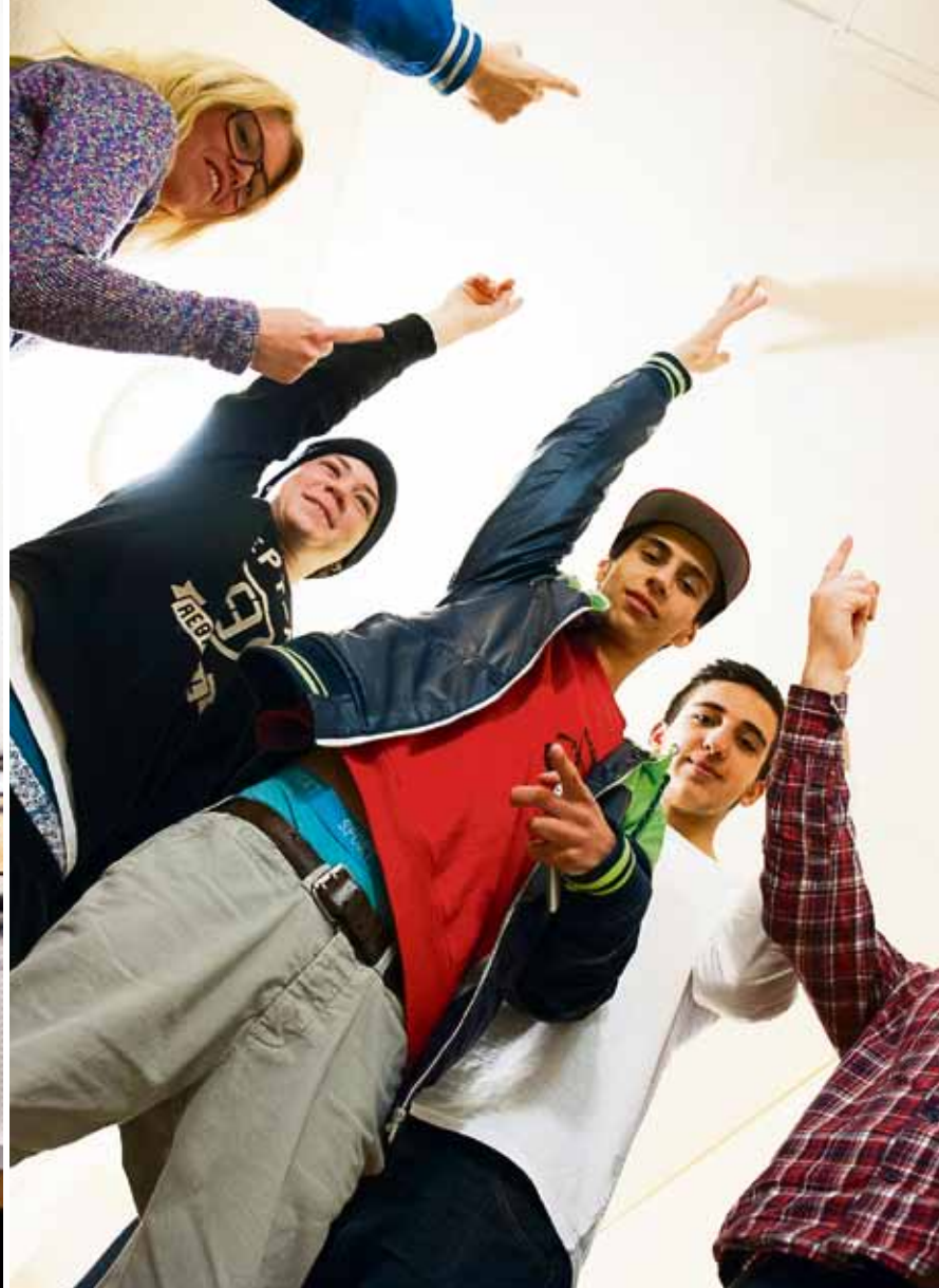
En idé är att utöka med lokaler i undervåningen, men då krävs en trappa. Här skulle den kunna hamna!