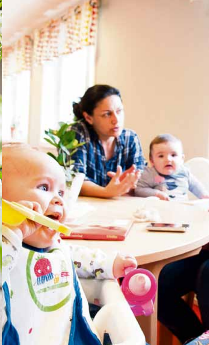
Runt fikaborden får både barn föräldrar utbyte av varandra.