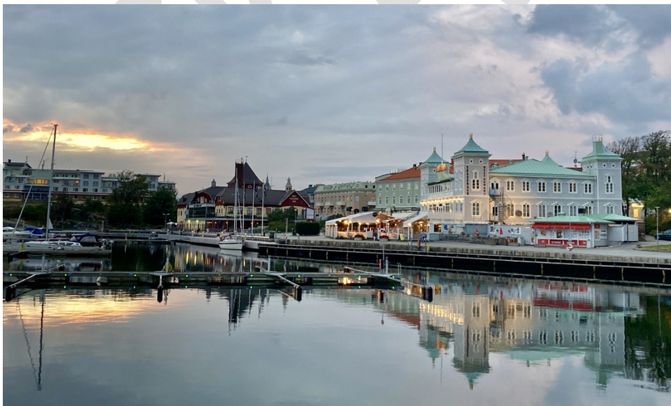
Det gamla societetshuset Skagerack nyinvides som kommunens kulturhus 2018.

Kulturstrategin ska följas upp med fyraåriga kulturplaner samt årsvisa verksamhetsplaner för kulturverksamheten som mer konkret beskriver de insatser som ska göras för att förverkliga ambitionen i kulturstrategin. Kulturskoleplan och biblioteksplan ingår också som en del av dessa konkreta verksamhetsplaner som följs upp med hjälp av nyckeltal och indikatorer mot uppsatta mål.